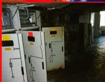
Stromausfall in Emmerich am Rhein